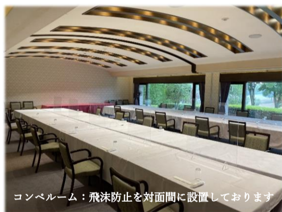
コンペルーム：飛沫防止を対面間に設置しております