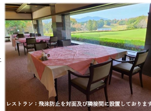
レストラン：飛沫防止を対面及び隣接間に設置しております